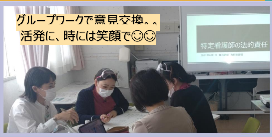
グループワークで意見交換。。 活発に、時には笑顔で☺☺