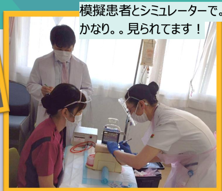
模擬患者とシミュレーターで。 かなり。。見られています！