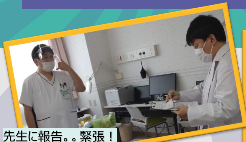
先生に報告。。緊張！ ※指導医は外部から来て頂いています☺